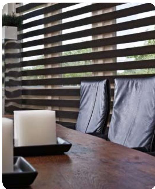
open, voor vrij doorzicht

Wanneer het duo rolgordijn volledig neergelaten is, heeft de stof altijd de gesloten stand. Dit biedt privacy doordat de niet-transparante banen hoger zijn dan de transparante banen en elkaar dus voldoende overlappen.