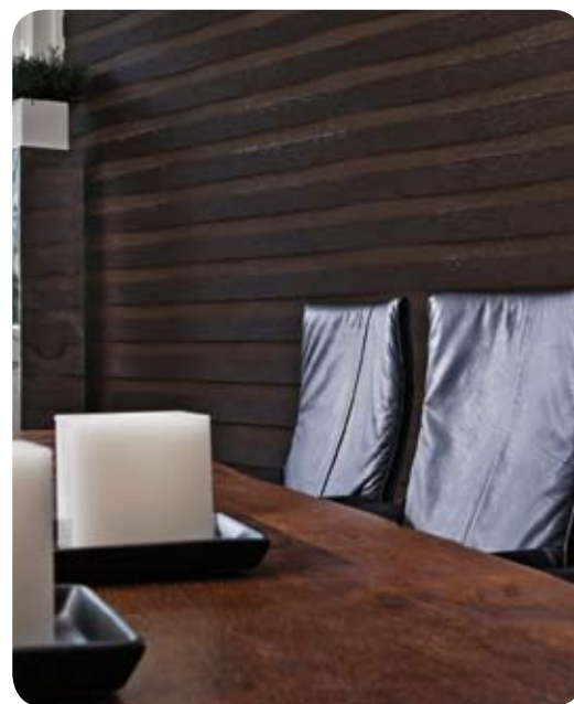
gesloten, voor privacy en maximale lichtwering