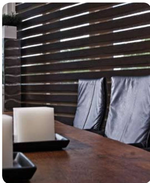
halfopen, voor gefilterde lichtinval